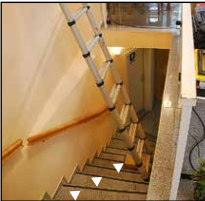
DAS war der Trick der Profis!